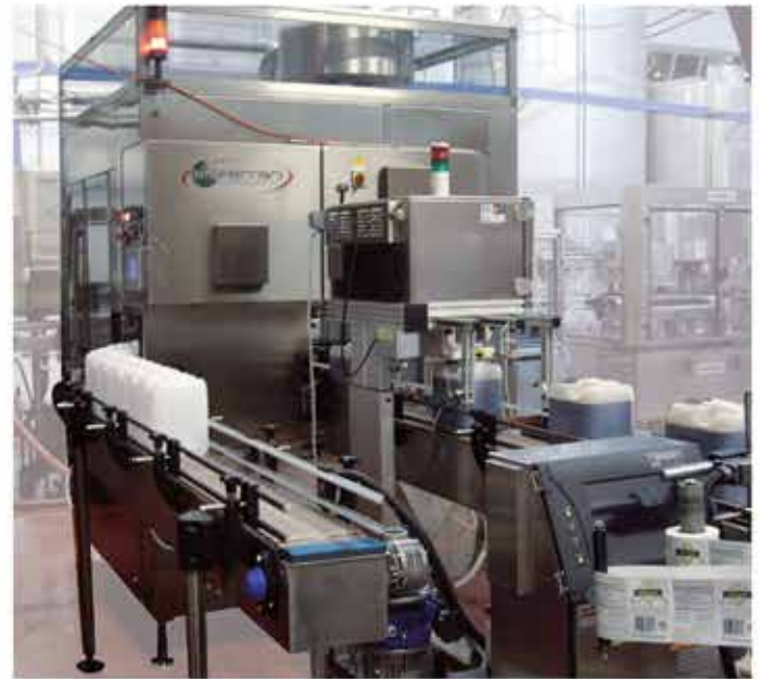
Volumetric Monoblock for jerry can - capping detail